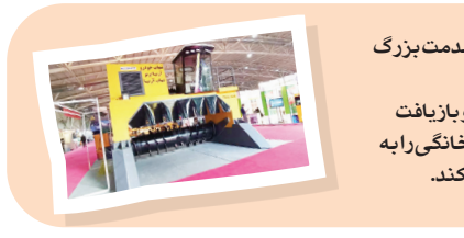
تفکیک و بازیافت زباله، این خدمت بزرگ را به کشور ارائه کند. دستگاه جدید ضمن تفکیک و بازیافت زباله‌ها، بخش زباله‌های تر خانگی را به کود فاقد آلاینده‌ی تبدیل می‌کند.